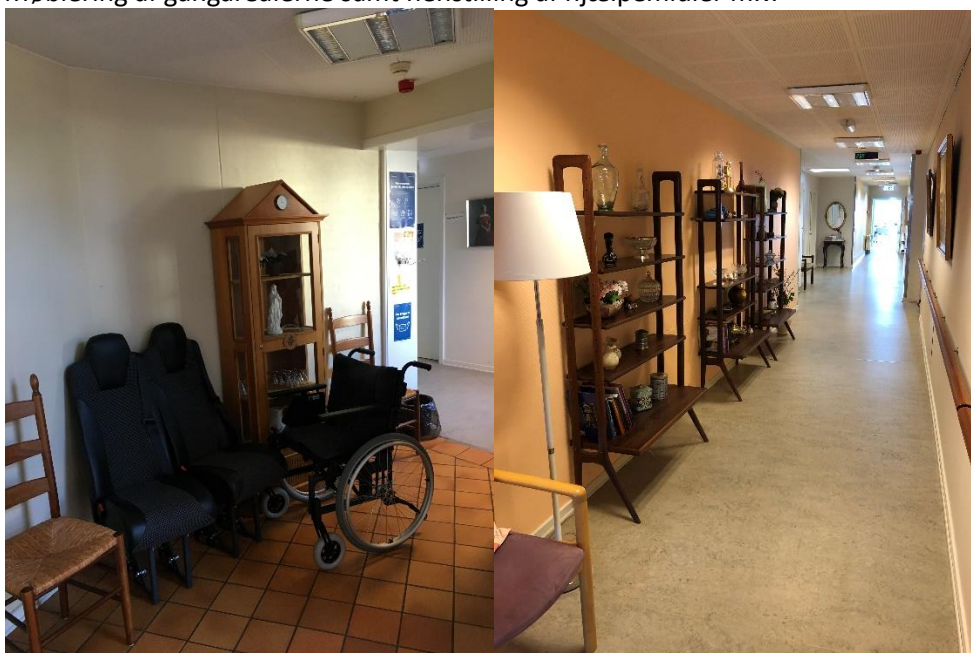
Figur 6: Opbevaring af hjælpemidler og møbler i flugtvejsgang (6.5.1 stk. 1)