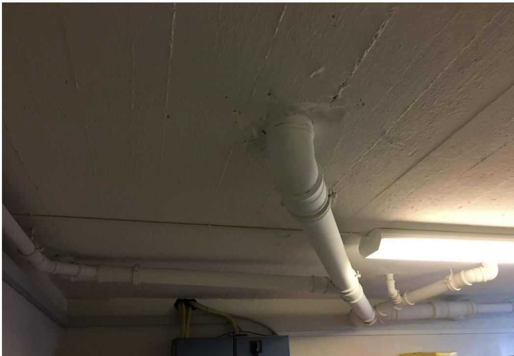
Figur 2: Manglende brandsikring og brandtætning ved faldstammer/afløb udført i plast i kælder