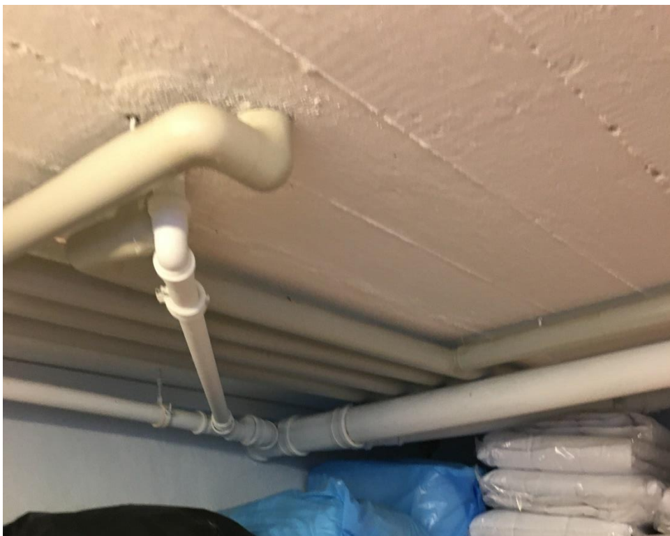
Figur 4: Manglende brandsikring og brandtætning ved faldstammer/afløb udført i plast i kælder.