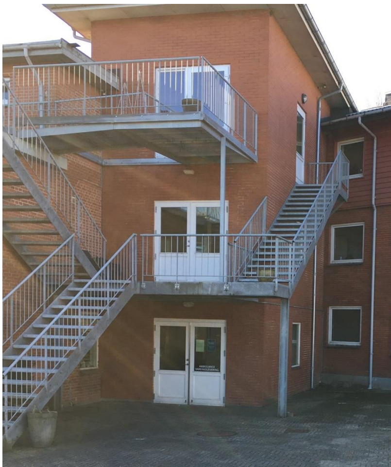
Figur 7 - Altangange og flugtvejstrapper fra 1. og 2. sal, skal indplaceres i enge brandsektioner. Samtidig skal trapperne udføres som bygningsdel klasse R 30 / A2-s1,d0 [BS-bygningsdel 30].

Det kunne ligeledes konstateres at flugtvejstrappe fra stue til terræn ikke har et trappeløb der gør det muligt at anvende denne trappe til båretransport.