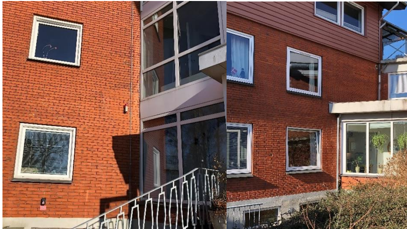
Figur 1 - Risiko for vinkelsmitte mellem brandsektioner