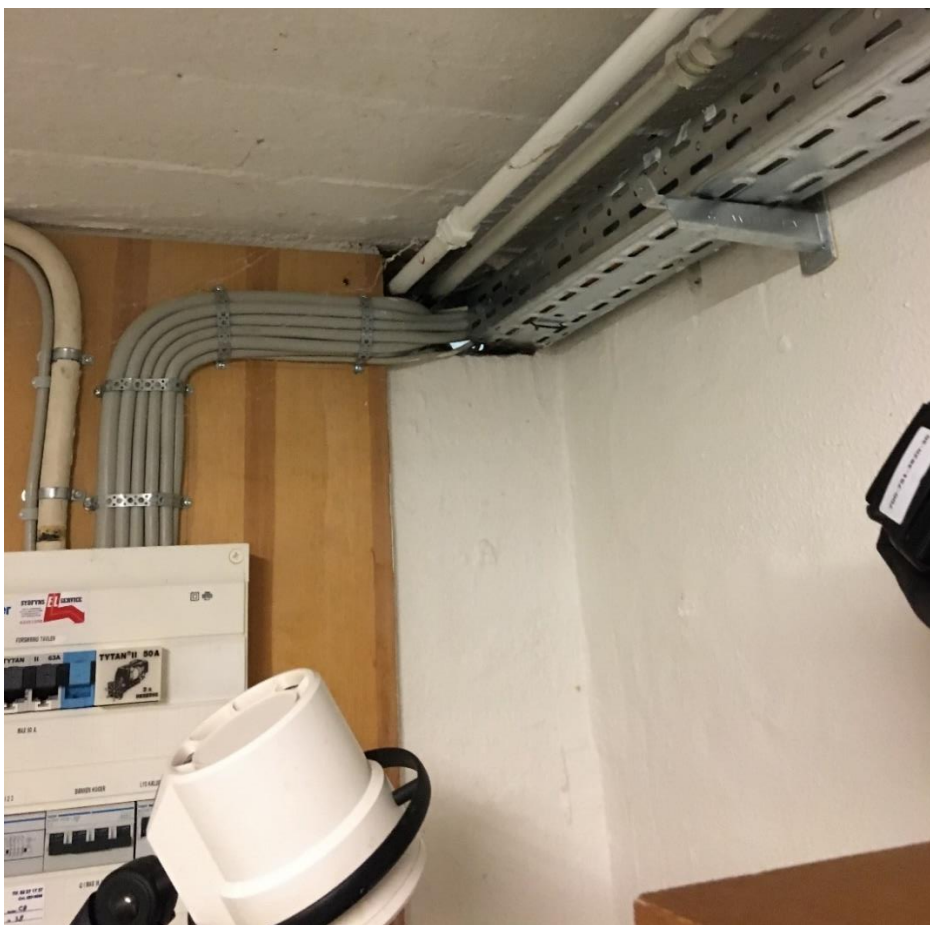
Figur 3: Manglende brandtætning ved installationsgennemføring i kælder