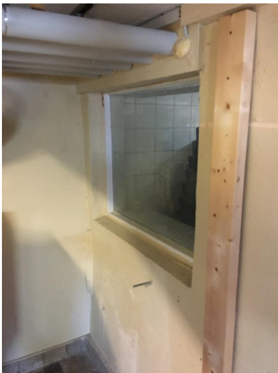
Figur 5: Manglende brandmæssig adskillelse fra depot til teknikrum