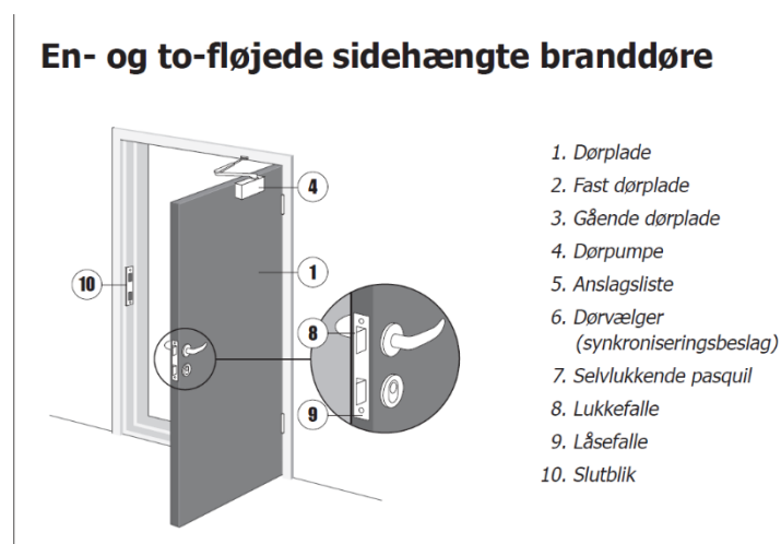
Illustration fra DBI vejledning 26 – Branddøre og brandskydeporte, 1. udgave, juni 1990.

DBI vejledning 26 – Branddøre og brandskydeporte. Branddøre skal udføres med låsekasse med lukkefalle og låsefalle. Se illustrationen herunder.