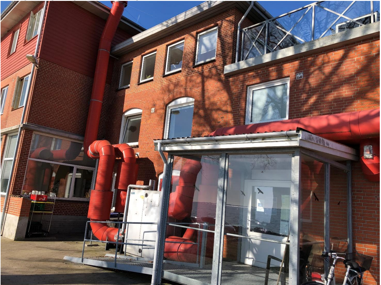
Figur 9 - Begrænset mulighed for at benytte redningsåbninger over ventilationsanlæg

Der blev på 1.sal konstaterede at enkelte værelser kunne have begrænset mulighed for at benytte redningsåbningerne grundet montering af ventilationsanlæg til køkkenet.